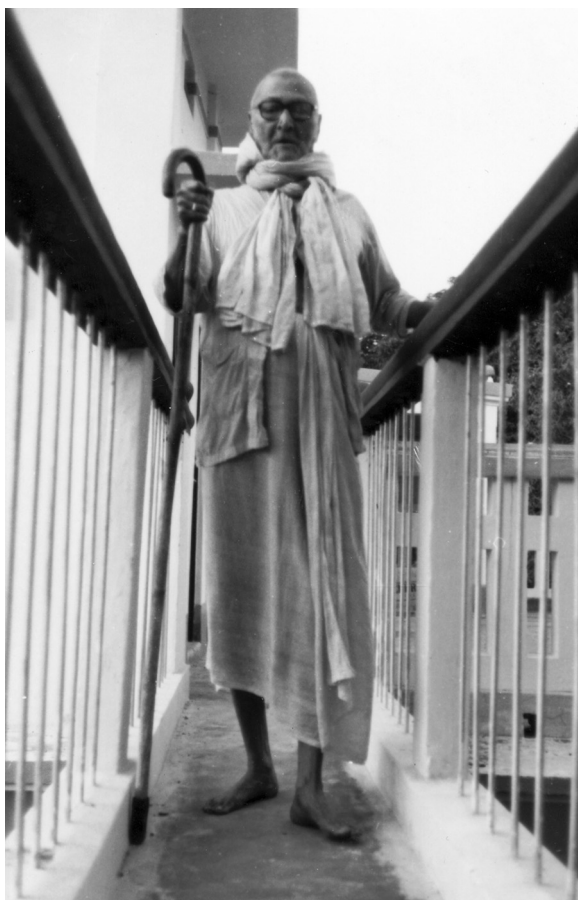
Шрила Бхакти Ракшак Шридхар Дев-Госвами Махарадж