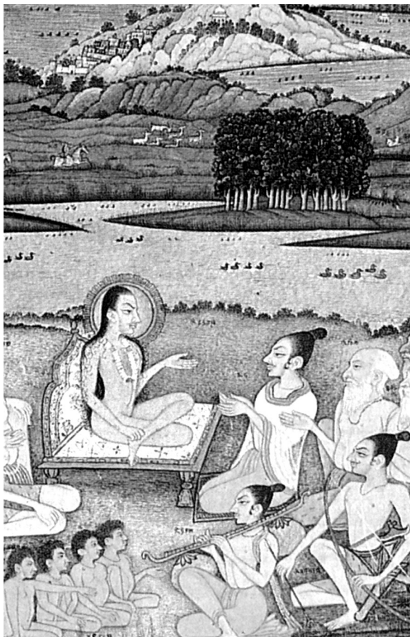
Шукадева Госвами рассказывает «Шримад Бхагаватам»