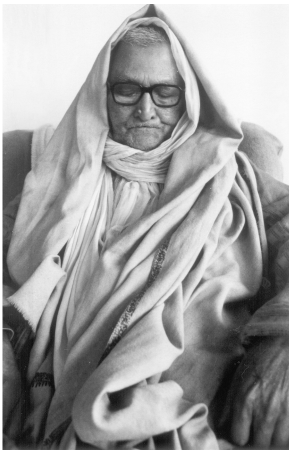
Шрила Бхакти Ракшак Шридхар Дев-Госвами Махарадж