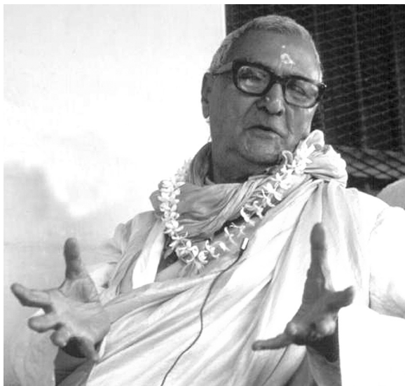
Шрила Бхакти Ракшак Шридхар Дев-Госвами Махарадж