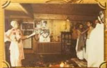
Бурдиче в Калачин парке црине Велесина Румбала Паблу