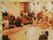
В «Загадочной Индии» в Петербурге «Шри»-деи Блаватки И.В.И.И.И.И.И.