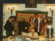
На премьере спектакля «Шакунтала» Киевского государственного театра им. Ив. Франко