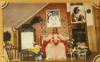
Полночь с святых Шрипада Парамананда Мхаладжи