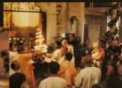
Шри Кришна Джаннаштами