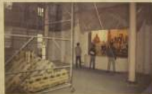
Внутренняя отделка храма еще не завершена, но работы проводятся регулярно