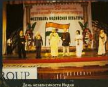
День независимости Индии в ДК Офицеров в Санкт-Петербурге