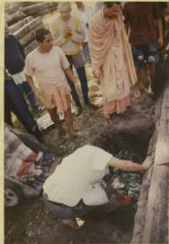
Церемония закладки камня в фундамент храма