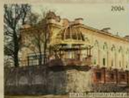
Площадь перед храмом и благоустройство двора