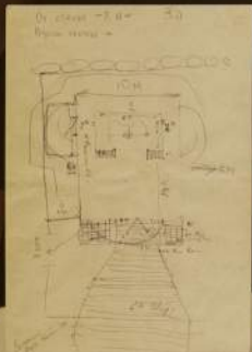
Жизнь будущего храма. Архитектор - Шрига Б.С. Толанда Макаради