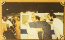
Школа Хурдиде приезжает в Лонгбридж