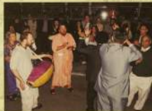
Фестиваль «Загадочная Индия», Кипр