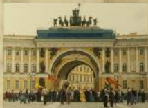
... и Дворцовой площади