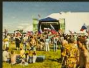
Фестиваль «Этнолайф» в Сорочанах