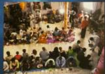
Празднование Шри Кришна Дванадшасти в Лакшинском Храме