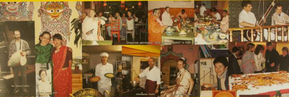
Открытие ресторана «Джаганнат-Экспресс» в 2000 году

Вегетарианский ресторан «Джаганнат-Экспресс» был открыт самим Гурudevом в 2000 году. Шричи Говинди Махарадж решил, тогда, что Гурудеву Джаганнату принадлежит все люди, приготовленные в этом ресторане. Таким образом, каждый день приготовления ресторана обещает великую Гурудеву.