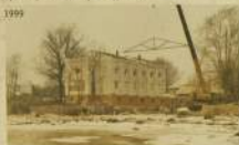
Летом храм был уже почти построен