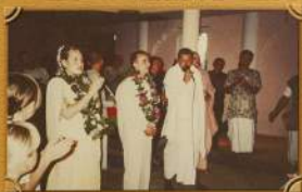
Свадьба Амриты Кришны Прабху и Амриты Ман Диди после-Фестивале