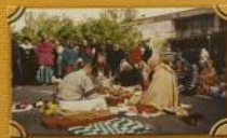
Первое бракосочетание в Австралии