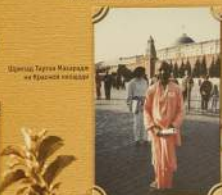
Шармар Таргын Навардонин на Красной площади