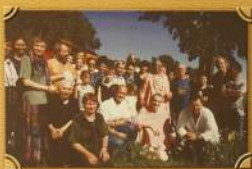
Долгожданная встреча с Гурджином