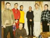
Проловодический тур. Шрилад Шуладрана Прабху