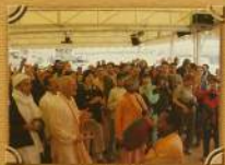
Свадьба на катере