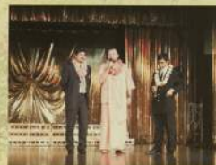
Фестиваль «Загадочная Индия», Москва