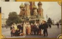
Первый национальный фестиваль в Москве