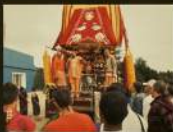
Ради-Ятра в Сорочанах, организованная преданними ИСККОН