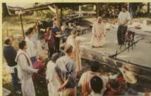
Церемония закладки камня в фундамент храма