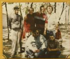
Первые российские предприниматели