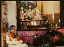
Шри Кришна Джаннаштами в Лакхитском Храме