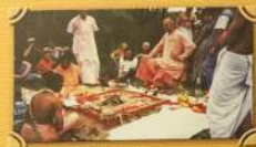
Дети играют в Восточном