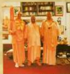
Принятие санахны Шрирадж Базети Ачинтай Модарови Махарадже