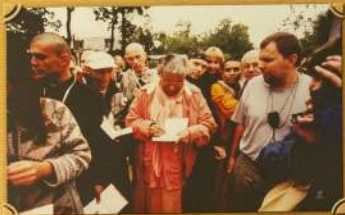
Шармар Бакагаад гала их уул Гурзу