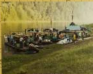
Отпуск по реке Енисей