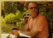
Связь по реке Яна с Шрираджи Модарови Махараджем