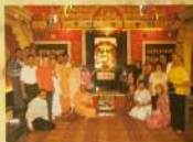
Региональный лидерский семинар с Модарови Махараджем