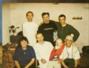
Проловодический тур московских детей по городам центральной России