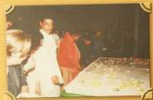
Внедрение ресторана «Деланган» вечера в Ялске