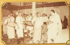
Шарпа Гурдунь запечатан чаёган