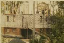
Храм строился быстро. Вид летом