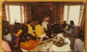
Алекса Рид Паблу и Сурмаво Кривоце Паблу цетериче Кривоце-мачокаса