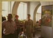
Выставка духовной живописи Индия в Запорожье