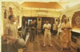
Промо-видеосери тур Шивады Общества Махараджи