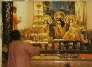
Презентация Шри Кришна Джа-маттане в латвийском храме