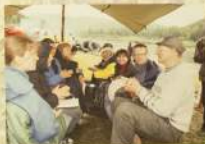
Спаив по реке Майне с Вагдатоном Врабцу