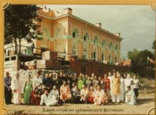
Вдоль парадной кувинского фестиваля