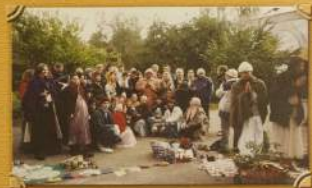
В России проводятся первые бракосочетания