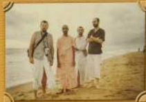
Панорамы по берегу Финского залива в Иркутске Таргын Навардонин