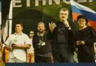
Фестиваль «Этнолайф» в Сорочанах