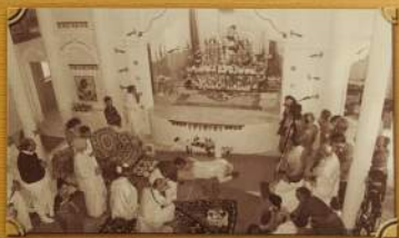
Шрипа Гурдас коронует величаны божеством Шри Шри-Гуру-Парам-Радио-Мхаладжи-мхаладжи