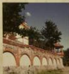
22 сентября 2005. Когда чакра была установлена, выложены ступени