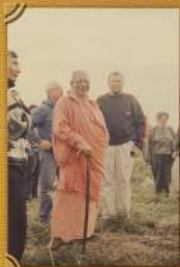
Летом Шрипа Гурдас вилла-поселка Ратнам