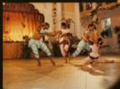
Балет "Блумика" в лакхитском храме