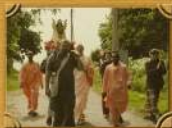
Шри Ваджай Витраха испытывает Свое владение