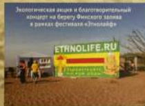
Экологическая акция и благотворительный концерт на берегу Финского залива в рамках фестиваля «Этнолайф»