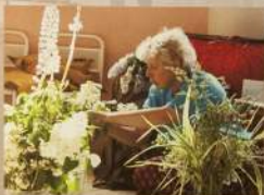
Ученик Деда и его помощницы создали прекрасный сад на территории храма