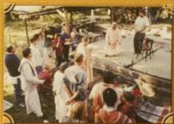
Закаладла камоч на иесте Бурдичего црине