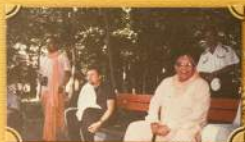
Школа Хурдиде на фестивале в Миссури