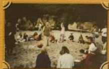
Тарга мачокаса в Трентсвафр