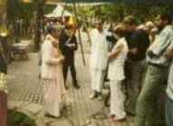
День независимости Индии в Милитарином парке в Москве