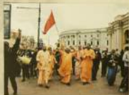
Карнама на Невском проспекте...