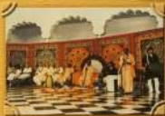
Программа в центре "Друтой Мир" Санкт-Петербурга