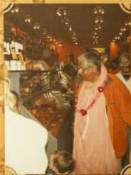
В ресторане «Джаганнат-экспресс»