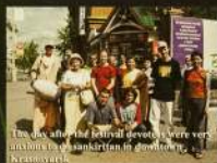
The day after the festival devotees were very excited to see sankirtan in their home Krasnoyarsk Проловодический тур. Шрилад Сиддханти Махарадхи