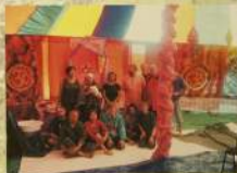
Фестиваль «Этика» в г. Зарвие в Видноострове