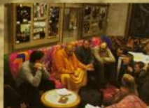
Фестиваль «Этнолайф» в гостинице «Санкт-Петербург»