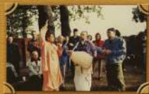
Вилла-вилла Страдхалокс храм