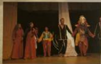
Театр «Мадхура» и Шригад Авадхут Махарадж в роли Шри Прасадхадева