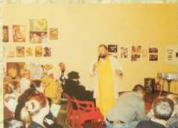
Фестиваль «Загадочная Индия», Петербург